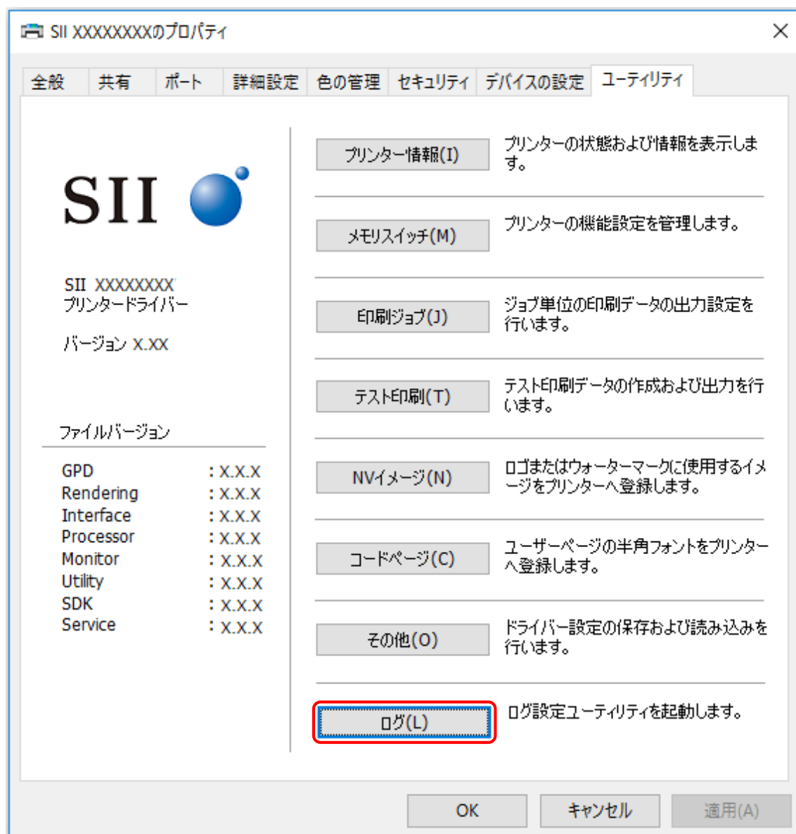
図 3-1 [ユーティリティ]画面